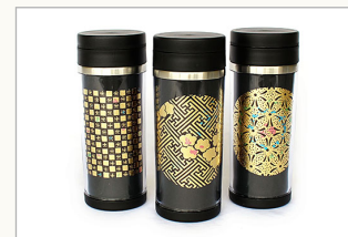
ステンレスボトル (350ml)